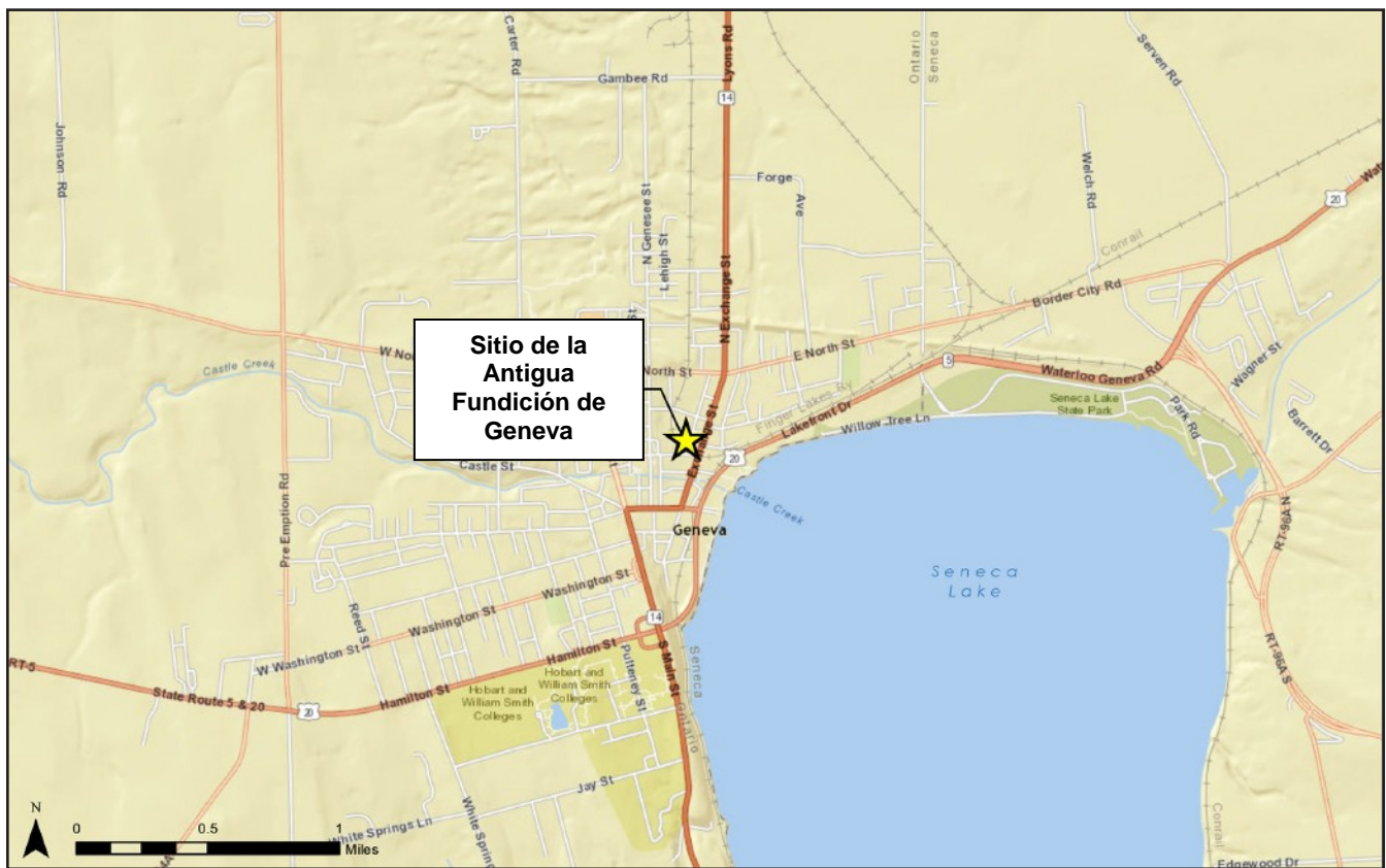
Figura 1 Ubicación del sitio, Antigua Fundición de Geneva N.º C835027A Geneva, Ontario County, New York